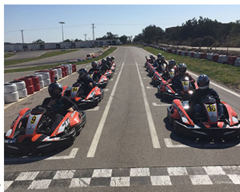
COLOCACIÓN SALIDA PARADA, CORRECTA