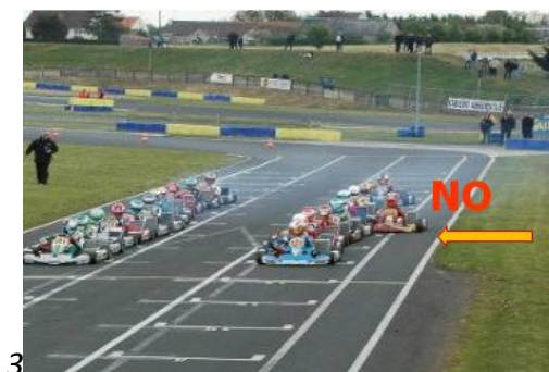
COLOCACIÓN SALIDA PARADA, INCORRECTA