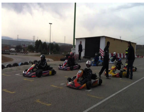
SALIDA LANZADA INCORRECTA "VERDE"